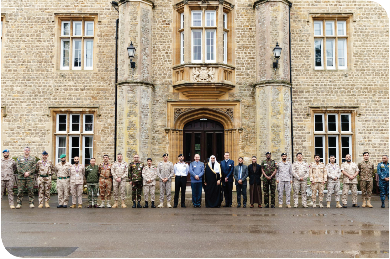
د. العيسى في لقطة جماعية مع القيادات الدولية أمام وزارة الدفاع البريطانية